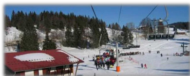
Bassins, août 2015