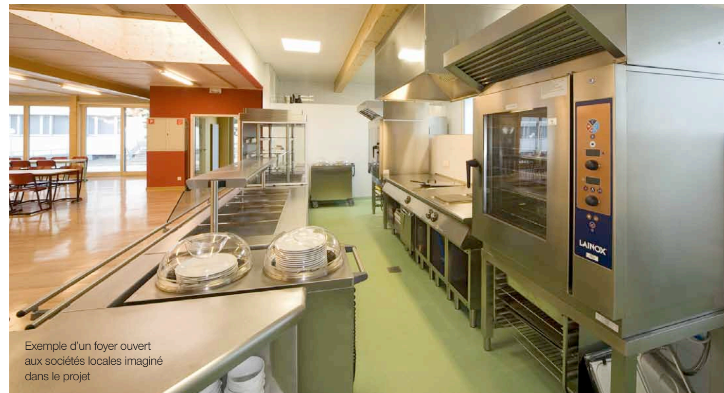
Exemple d'un foyer ouvert aux sociétés locales imaginé dans le projet

Le mardi 3 avril à 20 heures, tous les habitants sont conviés à un forum à la Grande Salle. Vous pourrez y découvrir tout ce que le plan d'amélioration foncier vous apporte et poser des questions aux différents intervenants présents.