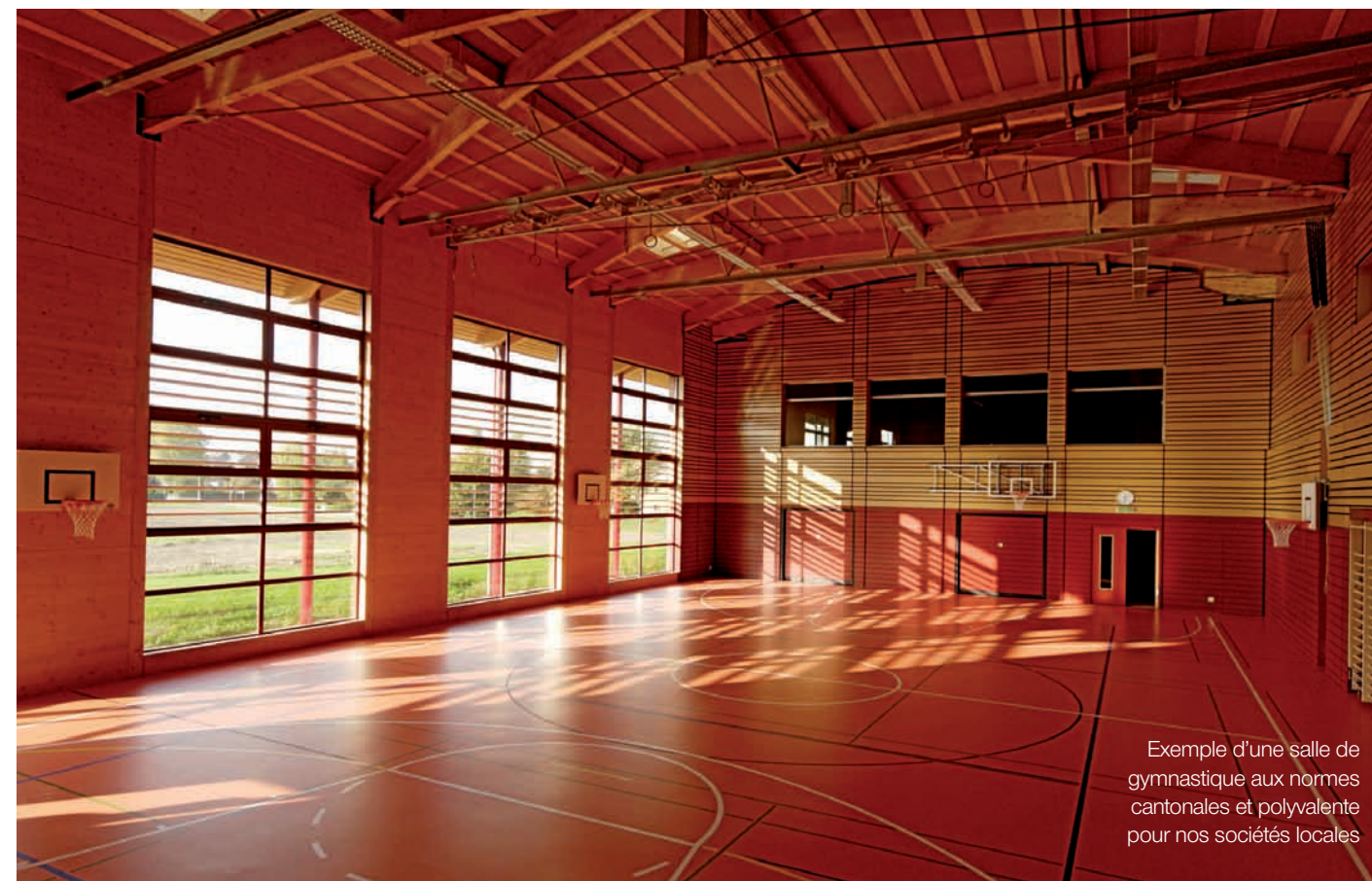
Exemple d'une salle de gymnastique aux normes cantonales et polyvalente pour nos sociétés locales

Les locaux de l'UAPE et de la garderie (rénovés, entretenus et financés par la fondation) se trouvent à quelques mètres des futurs logements. Une solution pratique pour les jeunes parents ou pour les grands-parents qui n'auront que quelques pas à faire pour aller retrouver leurs enfants.