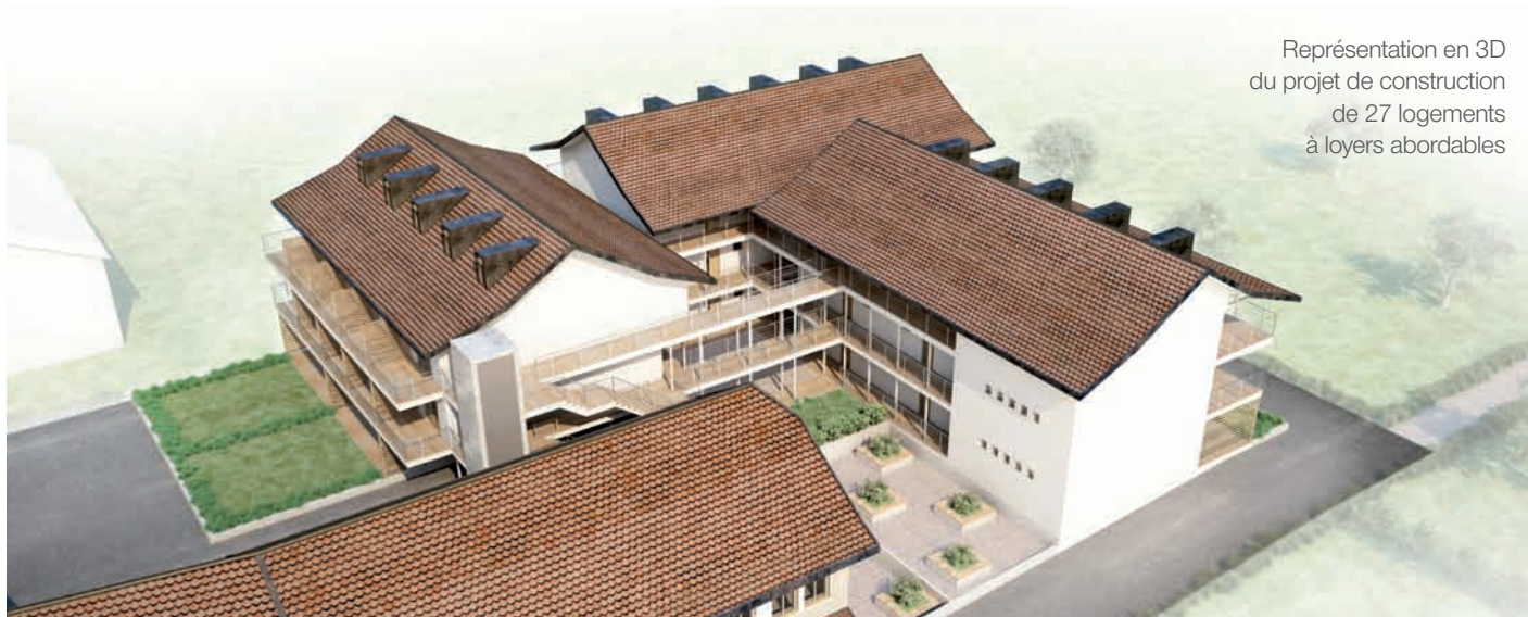
Représentation en 3D du projet de construction de 27 logements à loyers abordables