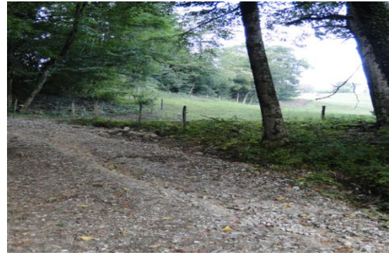
Erosion route gravellée (chemin de la Léchère)